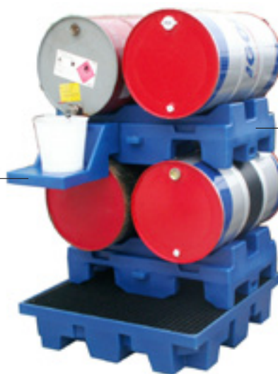
Support deux fûts 220 L gerbable SF2PC