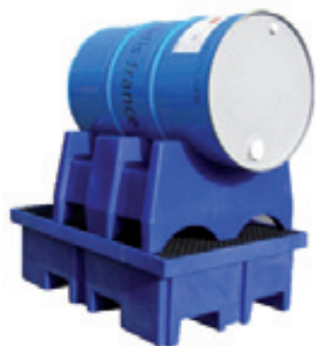
Support fût 60 et 200 litres SF60/200