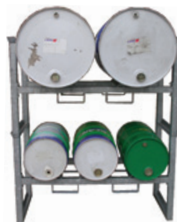
SFG2G Support fûts gerbable Mise en place sur PRG4C minimum