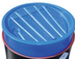
Entonnoir pour fût 220 litres ENT