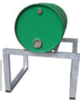
SFG1 Support 1 fût Mise en place sur PRG2C minimum