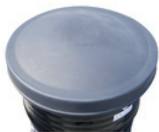
Couvercle pour fût 220 litres Disponible en noir, vert, jaune et bleu CD600